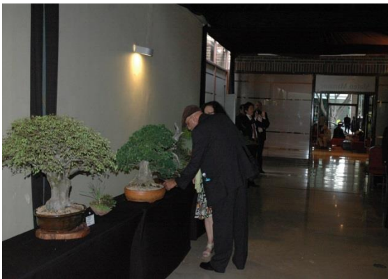
Exhibición de Bonsai