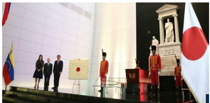
Ofrenda Floral en el Panteón Nacional