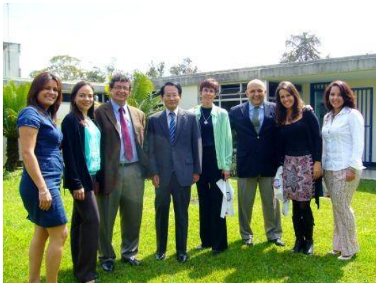
El Embajador Hayashi junto con los investigadores de la Unidad Terapia Celular