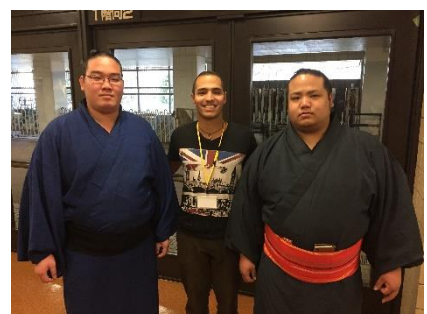
Figure 5 Lucha Tradicional Japonesa. Sumo.