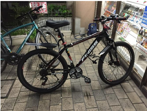
Figure 1.a Bicicleta

Para aprovechar al máximo esta nueva aventura académica y personal, tuve la oportunidad de comprar la bicicleta que se encuentra en la Figura 1.a. Ya que me permitió ver los alrededores con el tiempo que requería admirarlos. Adicionalmente esta adquisición me ayudó mucho a sobre llevar el alto costo de la vida y transporte dentro de Tokio, ahorrando para la futura mudanza que después de 1 año debía realizar.