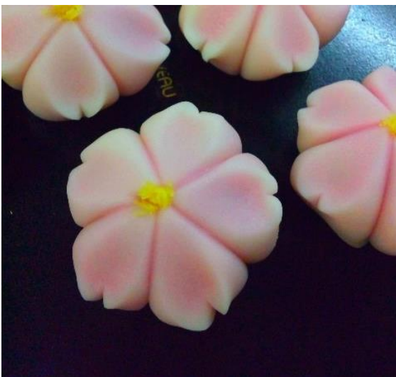
Figure 4.a Traditional Wagashi spring

Ejemplos de ello fue la realización de Wagashi (和菓子), estos son dulces tradicionales japoneses que cambian en forma y constitución dependiendo de la temporada del año en que se esté. Tuve la oportunidad de participar en una clase de cómo realizarlos, con un especialista en el área con más de 30 años de experiencia. Se puede ver un ejemplo del trabajo realizado en la Figura 3.a y 3.b; donde se aprecia una flor de loto elaborada a mano por un especialista y la resultante después de la clase tomada por mi persona, respectivamente.