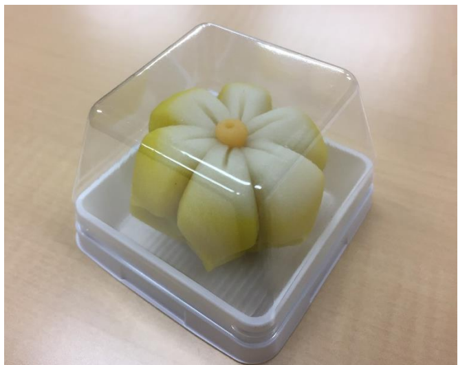
Figure 3.b Wagashi realizado después de la clase

Otra experiencia obtenida, esta vez por parte del departamento de relaciones internacionales, fue presenciar un torneo de lucha tradicional japonesa “Sumo”, en la cual pude sentir toda la energía y entusiasmo de los espectadores; que al igual que con el béisbol venezolano, los locales conocían a la perfección a los participantes y se veía éxtasis al ver a su personalidad favorita en la arena.