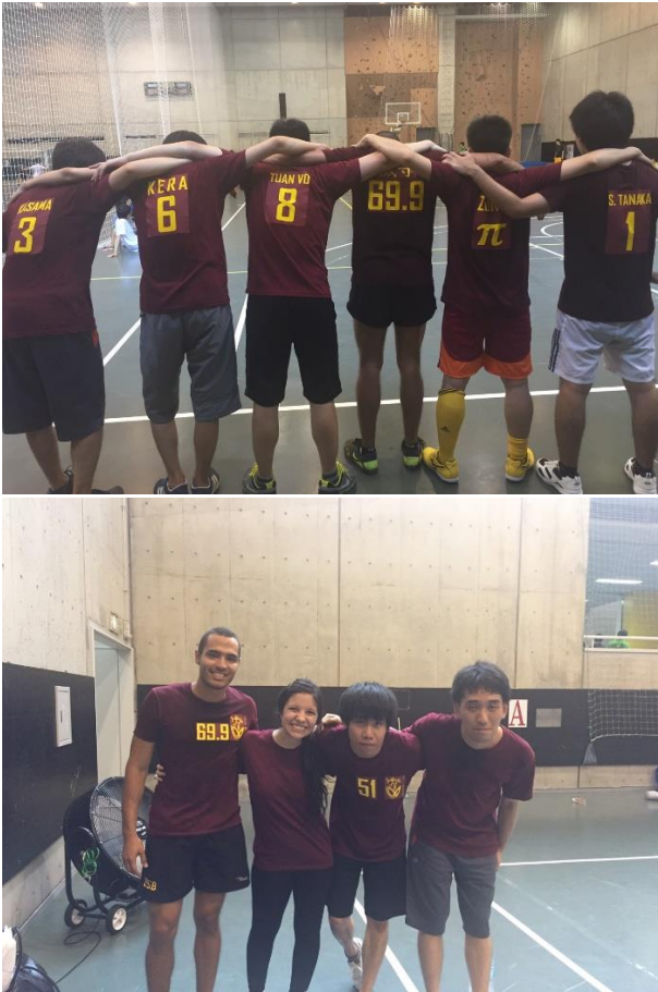
Figure 2 Torneo de Fútbol y Básquet

laboratorio se adaptaran a mí. Esto, precisamente por la diferencia cultural y porque ellos pensaban que no hablaba japonés y mucho menos pensaban en averiguarlo. Pudo haber sido pena, frialdad o miedo, pero logré buenas conversaciones y hacer buenos compañeros por medio del deporte, además de incluirlos en mi idea de organizarnos para hacer camisetas para el equipo de nuestro laboratorio.