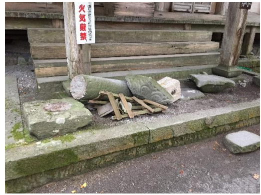
Figure 7.b Lampara de un Templo cercano

Al final, de todas las experiencias expuestas puedo decir que ha sido un viaje maravilloso y enriquecedor en muchos aspectos de mi vida. Lastimosamente, tratar de exponer todos los momentos vividos en mi estadía llevaría tiempo y páginas incontables de este diario; pero es un resumen que tomó los momentos que quedarán en mi cabeza por mucho tiempo.