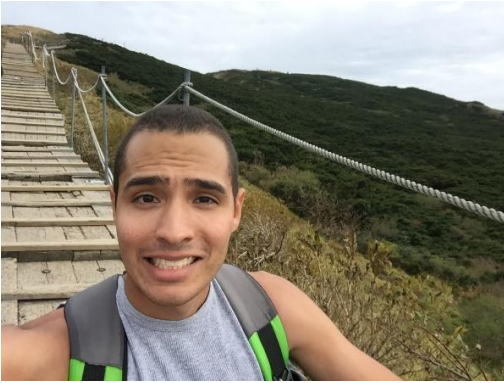
Figure 6.a Puente antes de la cima