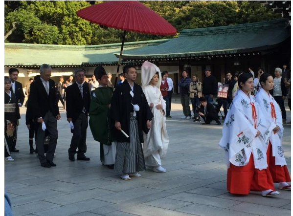
Figure 1.b Matrimonio tradicional japonés.

En la siguiente figura (Figure 1.b), se puede apreciar una boda tradicional japonesa realizada en el templo Meiji jingu ubicado en Harajuku, Tokio. Fue impresionante el ambiente y la energía que producía presenciar este evento; ya que toda la seriedad y el protocolo que conlleva no permitía los familiares y amigos hablaran durante el proceso, produciendo una tensión inmensa en los espectadores haciendo que ellos tampoco tuvieran ganas de producir sonido alguno.