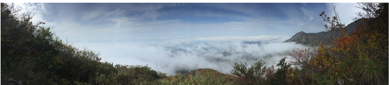
Figure 6 Montaña Daisen (大山)

Lastimosamente, el viaje fue para presenciar algunos estragos producidos por el terremoto, pero igualmente pudimos visitar lugares cercanos e interesantes.