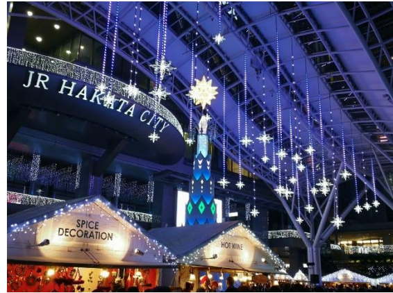
Hakata Station - Fukuoka

Llegaba el momento del curso de japonés, en el cual tuve el honor de ser seleccionado para dar el discurso de apertura del mismo la semana siguiente nuestra llegada, los profesores fueron muy buenos y pude ser capaz de mejorar mucho más mi nivel de japonés gracias a sus clases. Pero la etapa del curso no solo constaba de las clases de japonés, también hicimos varios viajes a distintas partes donde aprendimos un poco más de la Historia y Cultura de Japón.