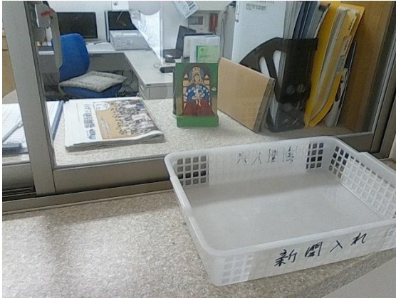
Virgen Chinita en el Dormitorio #3