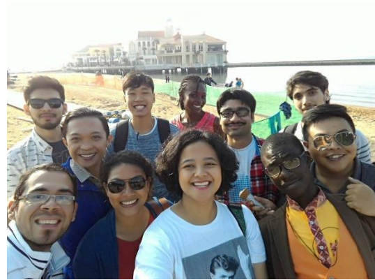
Visita a Momochi Beach - Fukuoka

La verdad, el haber estudiado japonés por más de 4 años en GOEN Maracaibo me ayudó muchísimo. Es totalmente distinto la persona que llega a Japón sin saber una palabra en japonés a aquella que tiene cuando menos un nivel básico o intermedio, y eso pude notarlo con otros de mis compañeros MEXT que llegaron junto conmigo, y muy pocos fuimos aquellos que llegamos con un cierto nivel de japonés, por lo que mi primera recomendación es: cuanto más puedas mejorar tu japonés, mejor.