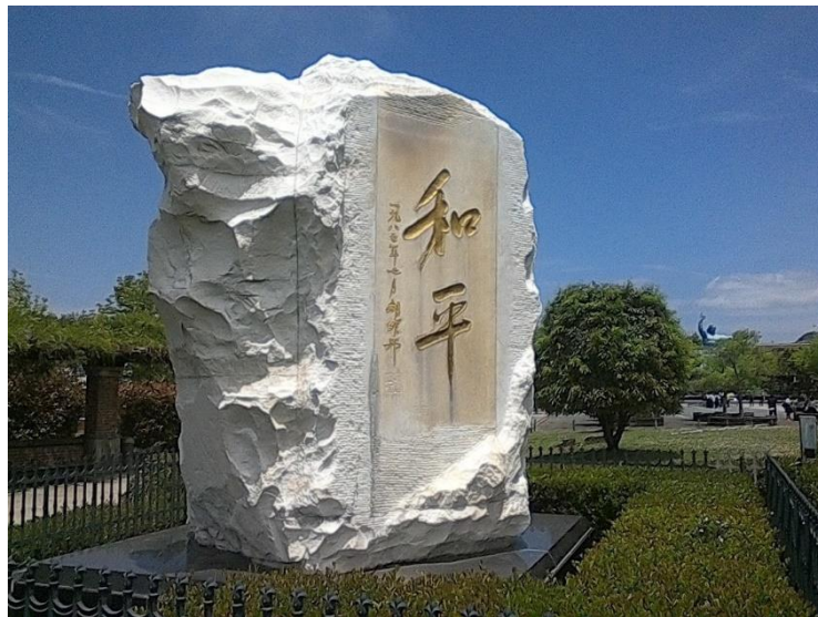
Parque de la Paz - Nagasaki

Para resumir, si tienes pensado aplicar para la beca, te animo a que lo hagas. La experiencia de cada persona que viene a Japón es distinta, pero en la mayoría de los casos es maravillosa y si vienen a Fukuoka no dejen de probar el Hakata Ramen!