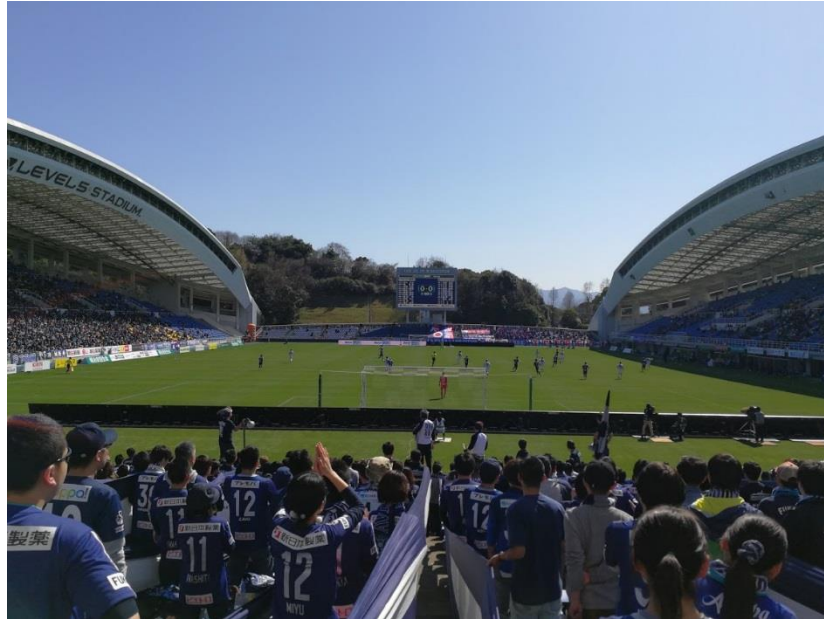
Estadio Level 5 - Fukuoka