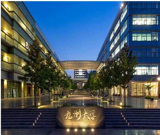
Kyushu Daigaku – Ito Campus

¿Cómo empezar? Pues quizás es importante mencionar que venir a Japón fue y sigue siendo hasta ahora mi primera y única experiencia fuera de Venezuela, por lo que todo mínimo detalle desde que dejé mi país al salir desde Maiquetia fue totalmente nuevo y emocionante. Luego de un largo pero a su vez muy entretenido viaje de más de 20 horas, llegué a Fukuoka el día 04 de abril de 2017. Luego de tramitar rápidamente en el Aeropuerto la ID o Zairyuu Kaado (在留カード) fue momento de esperar el transporte previamente programado por Kyushu Daigaku para llevarnos a Ito Campus a todos los estudiantes internacionales que llegamos para ese momento.