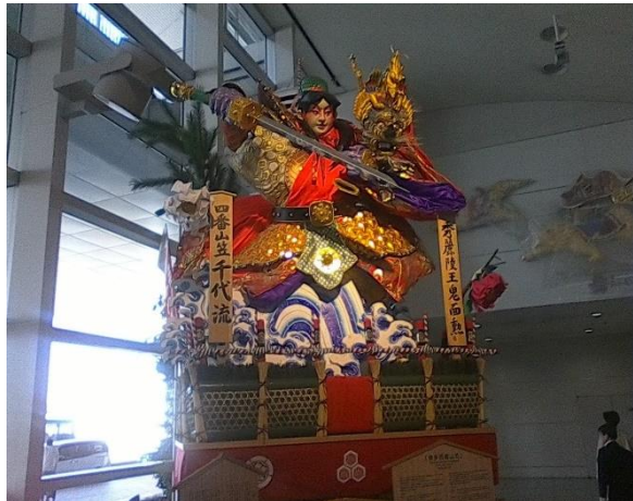
Estatua del Yamakasa Matsuri