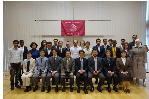
Profesores y estudiantes del curso de japonés

El campus donde se encuentra ubicado el laboratorio donde realizaré mi investigación es Chikushi Campus, uno de los pocos que no será trasladado. Debido a que existe una distancia considerable entre ambos campus, no tuve oportunidad de conocer a mi Profesor sino hasta un par de meses luego de mi llegada. Tanto mis profesores como compañeros de laboratorio y otros miembros del Staff me recibieron muy bien, siempre son amables y me han apoyado muchísimo.