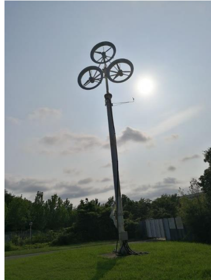
Wind Lens Turbine. Diseñada en Windeng Lab.

Al finalizar el curso de japonés, me mudé a un lugar cercano a Chikushi Campus, y de esta manera proceder a prepararme para la admisión a la Maestría, vida en el laboratorio e investigación.