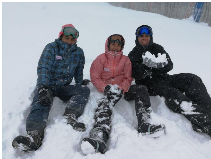
Mt. Gokase - Miyasaki