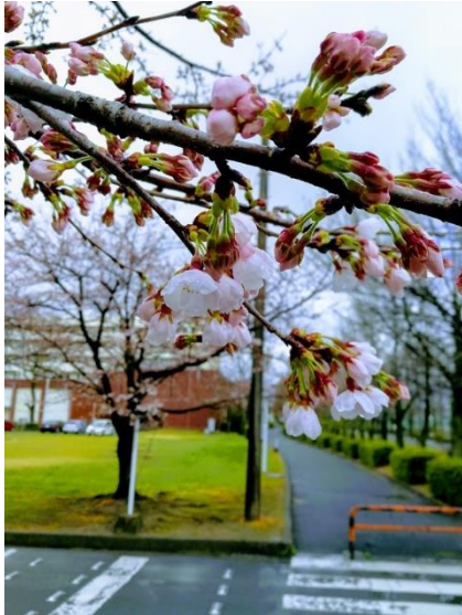
Primavera en Chikushi Campus

En nuestro laboratorio la rama de investigación es amplia, pero principalmente es relacionado con Energía Eólica. En este laboratorio se cubren principalmente dos frentes: CFD (Computational Fluid Dynamics) e innovación en el diseño de Turbinas Eólicas.